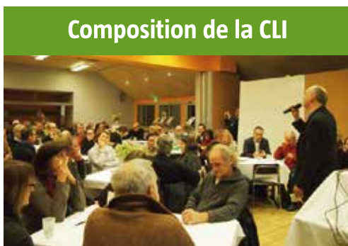
Composition de la CLI

La CLI doit compter au moins 50 % d'élus. Sur ses 43 membres on compte donc 22 élus . Les autres collègues représentent, chacun, au moins 10 % des membres