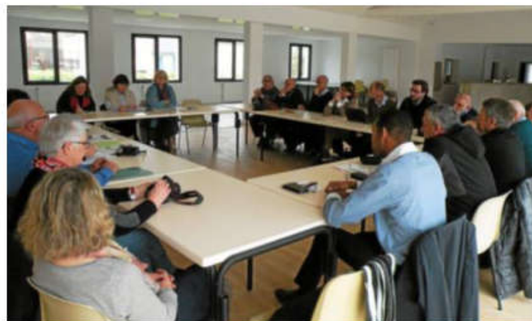
La municipalité de Brennilis a accueilli, mercredi matin, la délégation de la CLI de Nogent à la salle polyvalente.