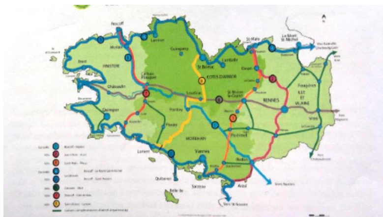
Schéma régional des véloroutes et voies vertes en Bretagne.

Le département du Finistère a aménagé en 2012 cinq kilomètres environ depuis le carrefour de Tal ar Groas jusqu'à la traversée du bourg de Crozon. Dans le présent projet, l'aménagement est étendu à l'ouest vers Camaret-sur-Mer et à l'est vers Telgruc-sur-Mer pour couvrir 20 km en presqu'île de Crozon.