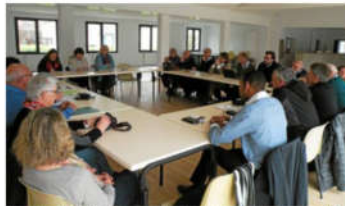
La municipalité de Brennilis a accueilli, mercredi matin, la délégation de la CLI de Nogent à la salle polyvalente.