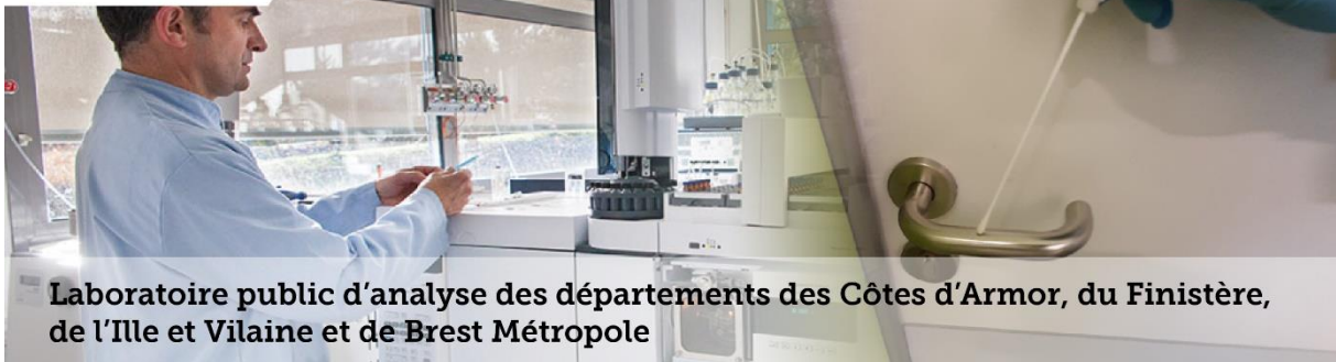
Laboratoire public d'analyse des départements des Côtes d'Armor, du Finistère, de l'Ille et Vilaine et de Brest Métropole