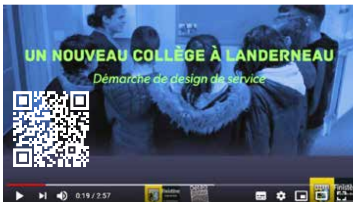
Visionnez la démarche de design de service sur la construction du second collège à Landerneau https://youtu.be/XRJ8I3oA_e4

Le design de service consiste à consulter les usagers pour identifier au plus juste les besoins du territoire concernant ce nouvel établissement. Elle a été menée par le cabinet DETEA qui a passé 3 jours au collège de Mescoat au cours du mois de juin 2019, au contact des élèves, des enseignant.e.s, des agents techniques et des personnels administratifs de l'établissement, des représentant.e.s des parents... ainsi que les maires et les représentant.e.s associatifs et culturels. Un atelier participatif s'est également tenu le 25 juin 2019 à la Maison pour tous de Landerneau.