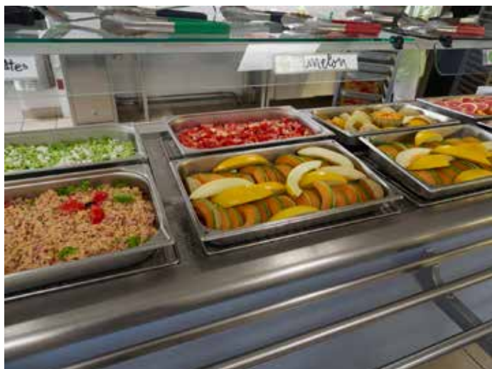
Mise en place de Salad'Bar dans l'offre de restauration

Le restaurant scolaire du collège de Mescoat sera également rénové.