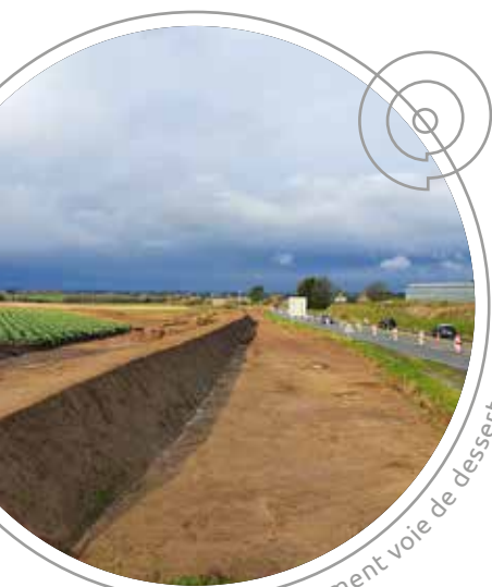
Meskoden terrassement voie de desserte